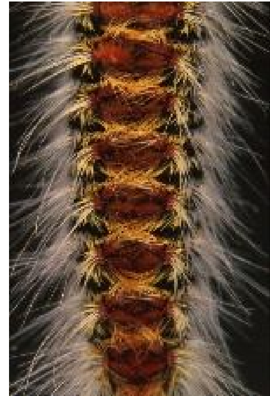
Particolare del dorso di una larva con gli specchi contenenti i peli urticanti