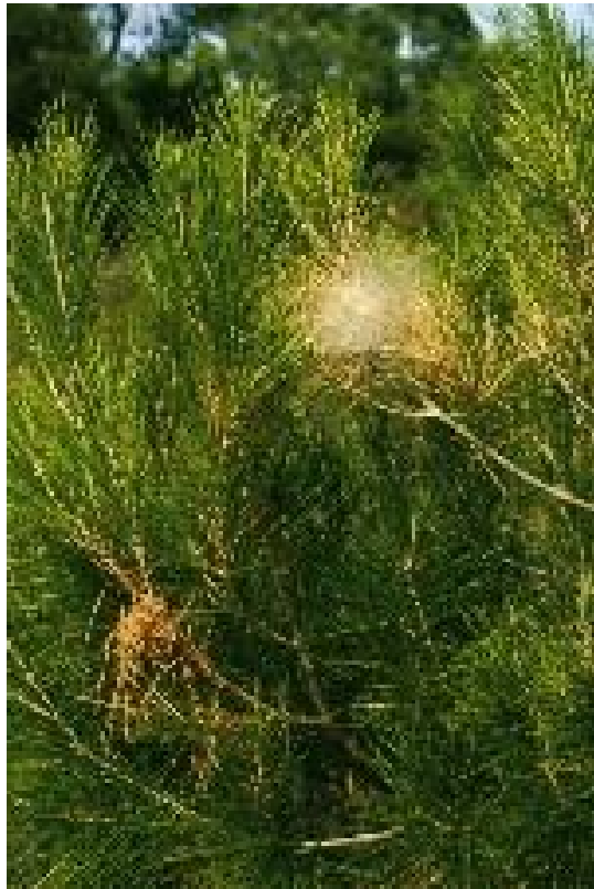
Prenido formato dalle larve giovani

Hanno funzioni di difesa e possono causare effetti nocivi su persone e animali.